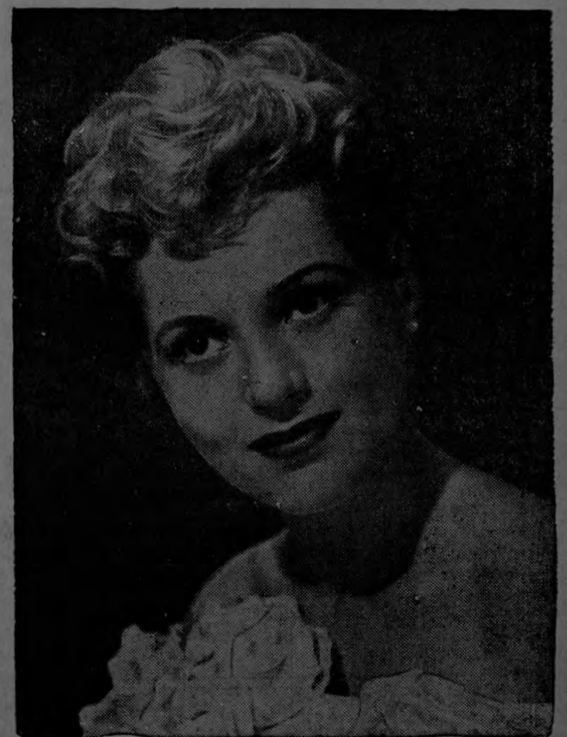
Judy Holliday, actriz de la Metro Goldwyn Mayer

Judy Holliday nació para comedia. Sus extraordinarias aptitudes cómicas fueron ampliamente demostradas en una reciente pieza teatral presentada en Broadway y la cual le valió un contrato de la Metro-GoldwynMayer para colaborar con Spencer Tracy y Katharine Hepburn en "La Costilla de Adán". Judy, originaria de Nueva York, comenzó a abrirse paso en el campo farandulero como telefonista en la compañía teatral de Orson Welles.